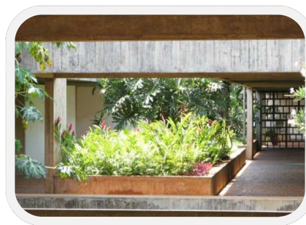
Ambassade de France à Brasília

RH1 prend acte, mais insiste sur le travail long, compliqué et onéreux que représente cet exercice. Ce dossier continuera d'être suivi de très près par la CFDT-MAE.