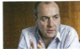
Laurent Berger, secrétaire général de la CFDT.

harcéleurs, qui se sentiront sous surveillance et y réfléchiront à deux fois avant d'agir.