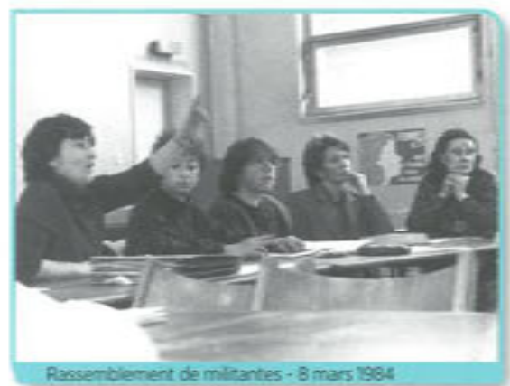
Rassemblement de militantes - 8 mars 1964

Les premières lignes de l'ouvrage (l'édito) sont écrites par Jeannette Laot, toujours secrétaire nationale CFDT à cette époque : « Au cours de plus de quinze années d'action et de réflexion sur les causes de la surexploitation des travailleuses, la CFDT a élaboré une politique revendicative originale liant étroitement lutte des classes et libération des femmes. Elle est la seule susceptible d'aboutir à la suppression des inégalités et des discriminations que subissent les travailleuses dans et hors de l'entreprise ».