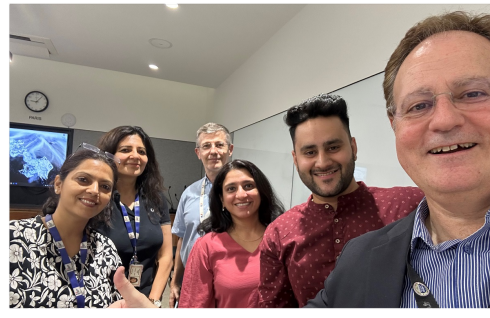
नई दिल्ली टीम